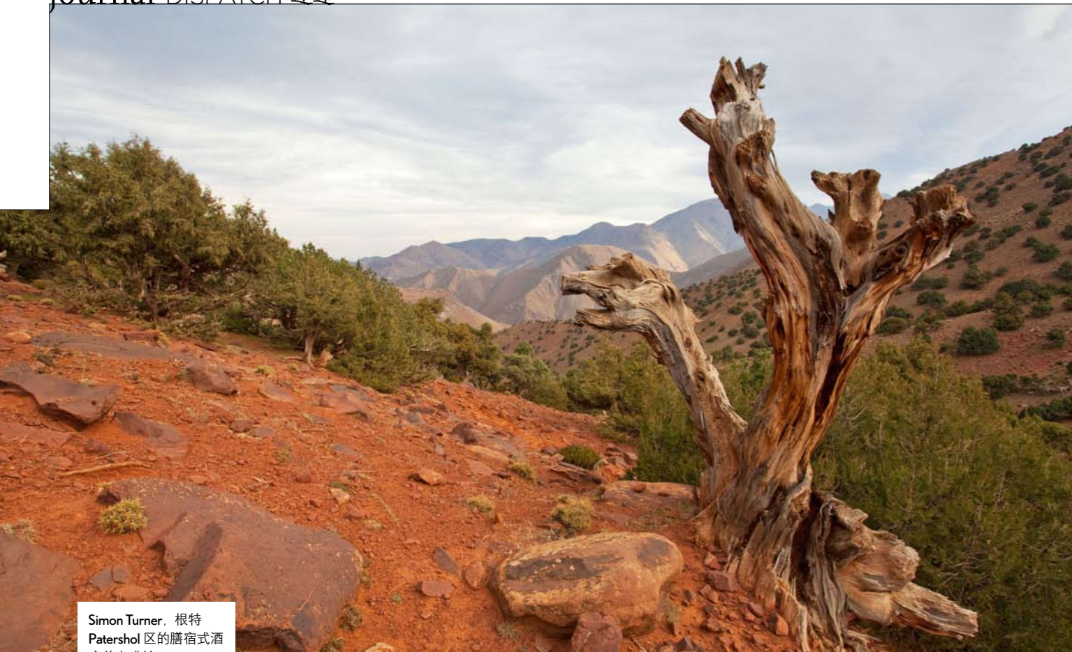
Simon Turner, 根特 Patershol 区的膳宿式酒店兼咖啡馆 Simon Says 的老板 Simon Turner, 根特 Patershol 区的膳宿式酒店兼咖啡馆 Simon Says 的老板 Simon Turner, 根特 Patershol 区的膳宿式酒店兼咖啡馆 Simon Says 的老板