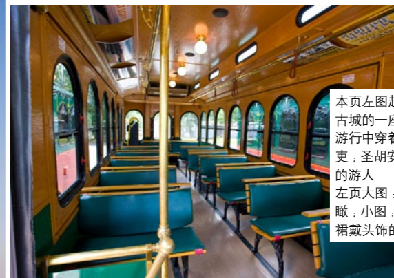
本页左图起：进入托雷多古城的一座城门；圣体节游行中穿着古装的当地官吏；圣胡安皇家修道院外的游人 左页大图：托雷多古城俯瞰；小图：穿镶蕾丝黑纱裙戴头饰的托雷多女孩